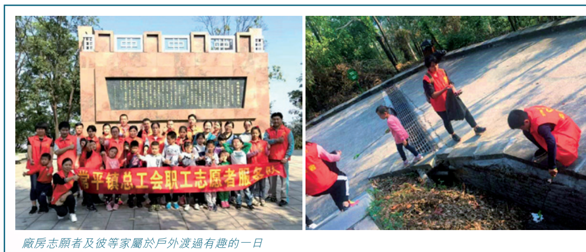
廠房志願者及彼等家屬於戶外渡過有趣的一日

本集團認為，此類活動不僅有利於員工的健康，亦有利於工作場所外的友情建設，改善跨部門溝通，促進員工之間的情誼，最終實現更和諧及高效的工作環境。