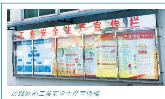
於廠區的工業安全生產宣傳欄

此外，本集團的政策為維持健康工作團隊、提升健康工作條件，並讓僱員維持健康生活模式。本集團於廠區提供各類體育設施，及持續每年舉辦兩次體育節。本集團每年安排醫生在生產基地為生產員工進行健康檢查。此外，本集團也參與附近社區中心及政府協會舉辦的各種體育賽事及休閒活動。