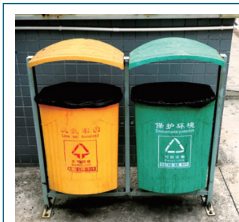
在廠區配備可回收及不可回收廢棄物分類設施

本集團致力於尋求實現廢棄物循環使用的方式，以促成綠色生活習慣，本集團在中國的製造附屬公司已就各種固體廢棄物的分類提供附帶「可回收物」、「不可回收物」及「有害物」標籤的廢棄物分類設施。有害廢棄物將獲收集，並由本集團委聘的合資格公司處理。