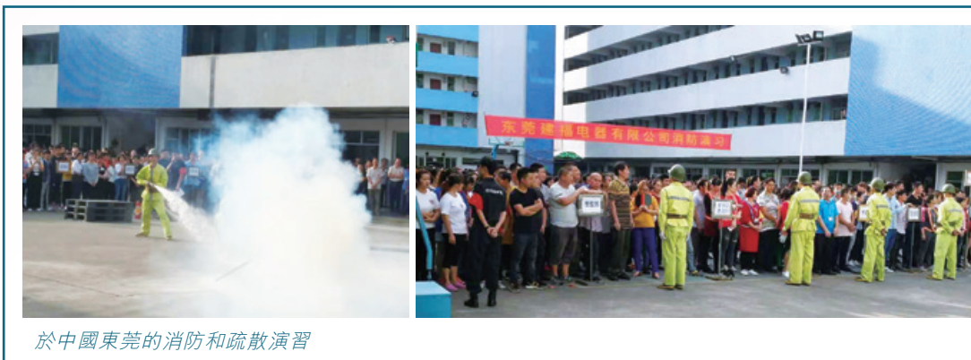
於中國東莞的消防和疏散演習