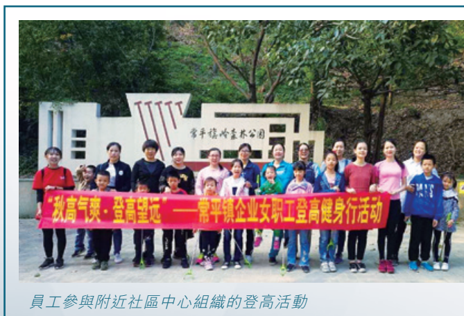
員工參與附近社區中心組織的登高活動