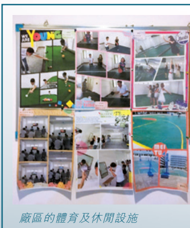
廠區的體育及休閒設施

此外，本集團的政策為維持健康工作團隊、提升健康工作條件，並讓僱員維持健康生活模式。本集團於廠區提供各類體育設施，及持續每年舉辦兩次體育節。本集團每年安排醫生在生產基地為生產員工進行健康檢查。此外，本集團也參與附近社區中心及政府協會舉辦的各種體育賽事及休閒活動。