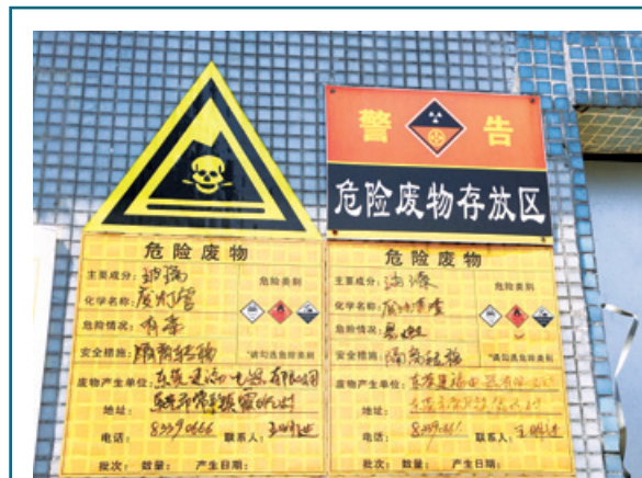
在生產車間設置有害廢棄物存放區