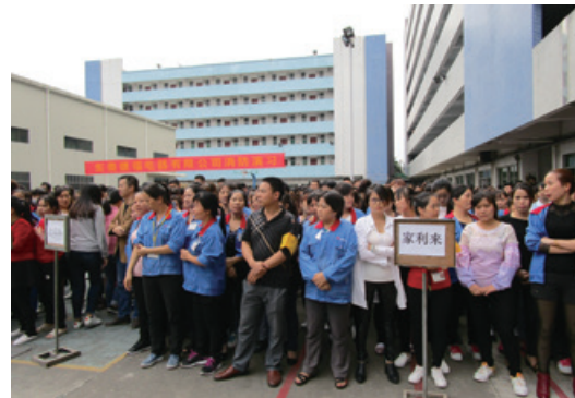
於中國東莞的消防和火警演習