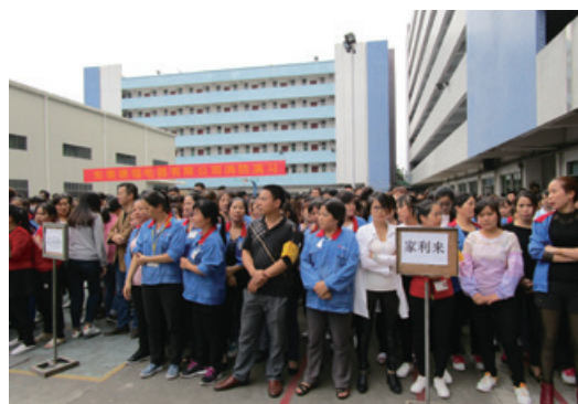
於中國東莞的消防和火警演習